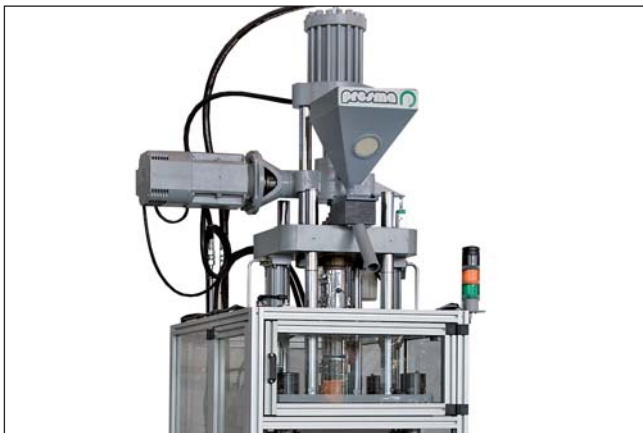
zona iniezione / Injection zone

Vertical injection moulding machine with piston clamping for the injection of thermoplastic resins. Regulation of screw rotation speed through Inverter. Mechanical ejection. Monitored hydraulic safety Pump with variable cylinder capacity with closed ring.