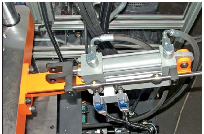
cilindro martinetto / Core cylinder